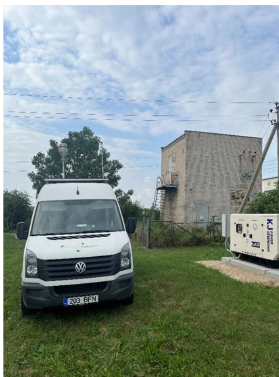
1 Pav. Mobilioji transporto priemonė ir tyrimo vieta

UAB Kauno kogeneracinė jėgainė užsakė 24 valandų trukmės aplinkos oro kokybės vertinimo ir stebėjimo tyrimą Ramučiuose, Kauno raj. Tyrimas atliktas 2022 08 22 – 2022 08 23 dienomis. Matavimai atlikti ir oro kokybė įvertinta vietoje, kurios koordinatės – 54°56'27.5"N; 24°02'17.4"E (žr. 1 ir 4 paveikslus). Matavimo rezultatai surinkti siekiant nustatyti oro teršalų koncentracijos dydį aplinkos ore bei įvertinti toliau pateiktų teršalų kieki: vandenilio chlorido (HCl), vandenilio fluorida (HF), amoniako (NH 3 ), benzo(a)pireno (B(a)P) ir dioksinų/furanų (PCDD/Fs).