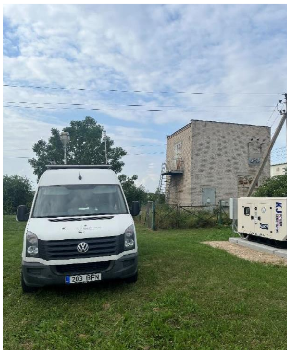
3 Pav. Mobilioji transporto priemonė ir tyrimo vieta