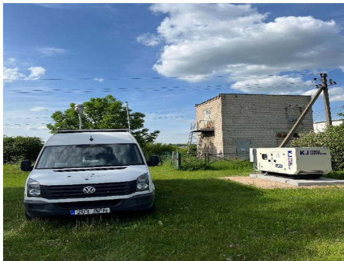
1 Pav. Mobilioji transporto priemonė ir tyrimo vieta

UAB Kauno kogeneracinė jėgainė užsakė 24 valandų trukmės aplinkos oro kokybės vertinimo ir stebėjimo tyrimą Ramučiuose, Kauno raj. Tyrimas atliktas 2022 06 06 – 2022 06 07 dienomis. Matavimai atlikti ir oro kokybė įvertinta vietoje, kurios koordinatės – 54°56'27.5"N; 24°02'17.4"E (žr. 1 ir 4 paveikslus). Matavimo rezultatai surinkti siekiant nustatyti oro teršalų koncentracijos dydį aplinkos ore bei įvertinti toliau pateiktų teršalų kieki: vandenilio chlorido (HCl), vandenilio fluorida (HF), amoniako (NH 3 ), benzo(a)pireno (B(a)P). Taip pat, vietoje buvo išmatuoti meteorologiniai parametrai.