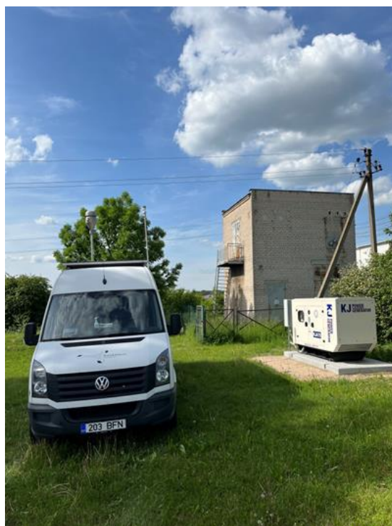
3 Pav. Mobilioji transporto priemonė ir tyrimo vieta