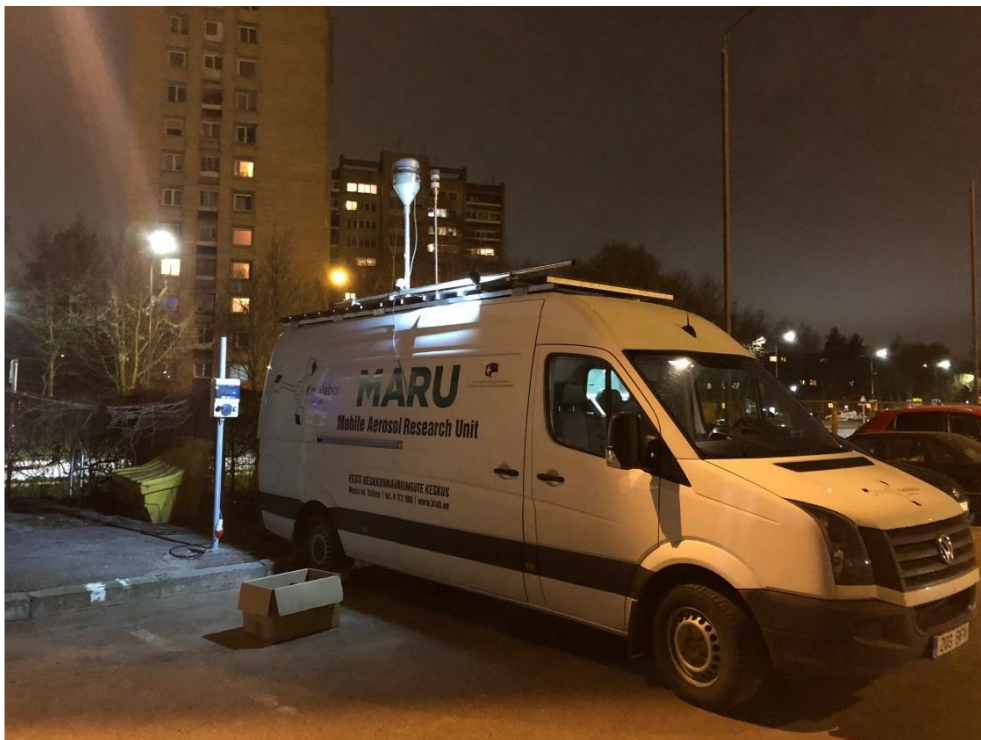
1 paveikslas. Mobilioji transporto priemonė ir tyrimo vieta

UAB Kauno kogeneracinė jėgainė užsakė 24 valandų trukmės aplinkos oro kokybės vertinimo ir stebėjimo tyrimą Kauno m. Partizanų g. 79. Tyrimas atliktas 2018 11 20 – 2018 11 21 dienomis. Matavimai atlikti ir oro kokybė įvertinta vietoje, kurios koordinatės – 54°55'47.3"N; 23°59'45.2"E (žr. 1 ir 2 paveikslus). Matavimo rezultatai surinkti siekiant nustatyti oro teršalų koncentracijos dydį aplinkos ore bei įvertinti toliau pateiktų teršalų kiekį: vandenilio chlorido (HCl), vandenilio fluorida (HF), amoniako (NH 3 ), benzo(a)pireno (B(a)P). Taip pat tyrimo metu atlikti vietos meteorologinių parametru matavimai.