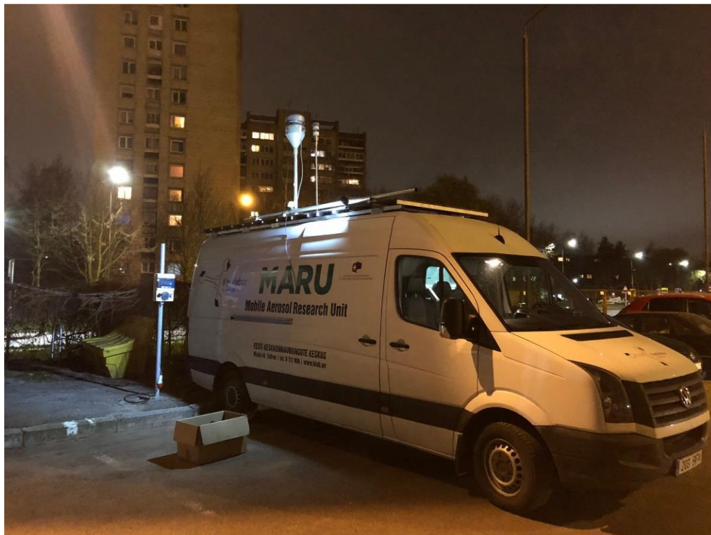
3 paveikslas. Mobilioji transporto priemonė ir tyrimo vieta