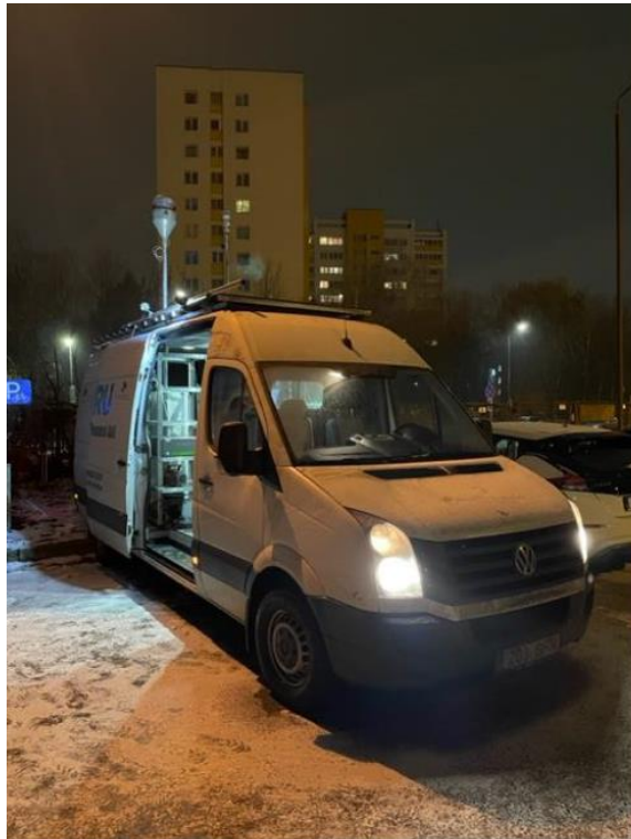
3 Pav. Mobilioji transporto priemonė ir tyrimo vieta