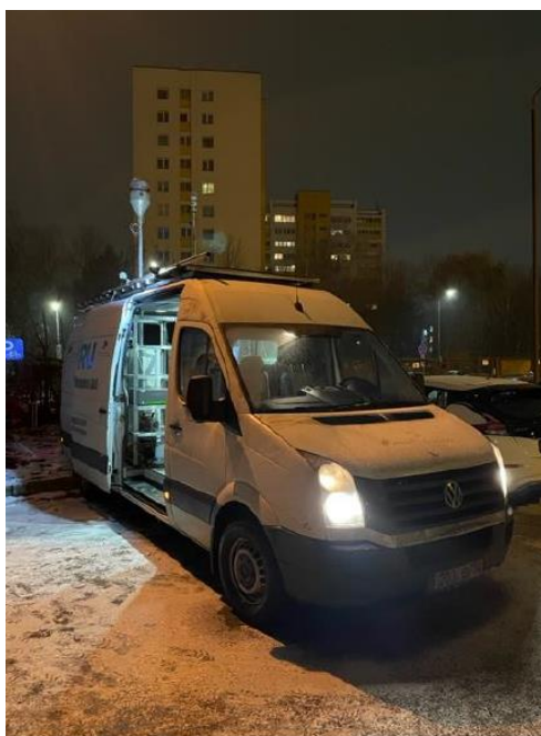
1 Pav. Mobilioji transporto priemonė ir tyrimo vieta

UAB Kauno kogeneracinė jėgainė užsakė 24 valandų trukmės aplinkos oro kokybės vertinimo ir stebėjimo tyrimą Kauno m. Partizanų g. 79. Tyrimas atliktas 2022 11 22 – 2022 11 23 dienomis. Matavimai atlikti ir oro kokybė įvertinta vietoje, kurios koordinatės – 54°55'47.3"N; 23°59'45.2"E (žr. 1 ir 4 paveikslus). Matavimo rezultatai surinkti siekiant nustatyti oro teršalų koncentracijos dydį aplinkos ore bei įvertinti toliau pateiktų teršalų kiekį: vandenilio chlorido (HCl), vandenilio fluorida (HF), amoniako (NH 3 ), benzo(a)pireno (B(a)P). Taip pat, vietoje buvo išmatuoti meteorologiniai parametrai.