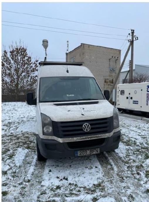
3 Pav. Mobilioji transporto priemonė ir tyrimo vieta