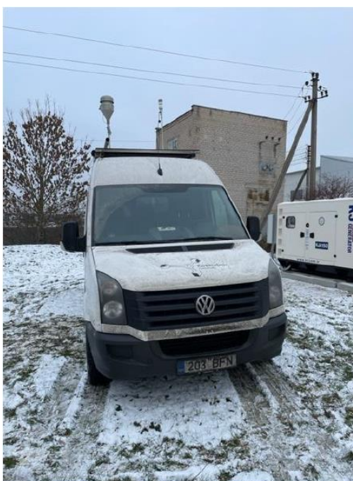
1 Pav. Mobilioji transporto priemonė ir tyrimo vieta

UAB Kauno kogeneracinė jėgainė užsakė 24 valandų trukmės aplinkos oro kokybės vertinimo ir stebėjimo tyrimą Ramučiuose, Kauno raj. Tyrimas atliktas 2022 11 21 – 2022 11 22 dienomis. Matavimai atlikti ir oro kokybė įvertinta vietoje, kurios koordinatės – 54°56'27.5"N; 24°02'17.4"E (žr. 1 ir 4 paveikslus). Matavimo rezultatai surinkti siekiant nustatyti oro teršalų koncentracijos dydį aplinkos ore bei įvertinti toliau pateiktų teršalų kiekį: vandenilio chlorido (HCl), vandenilio fluorida (HF), amoniako (NH 3 ), benzo(a)pireno (B(a)P). Taip pat, vietoje buvo išmatuoti meteorologiniai parametrai.