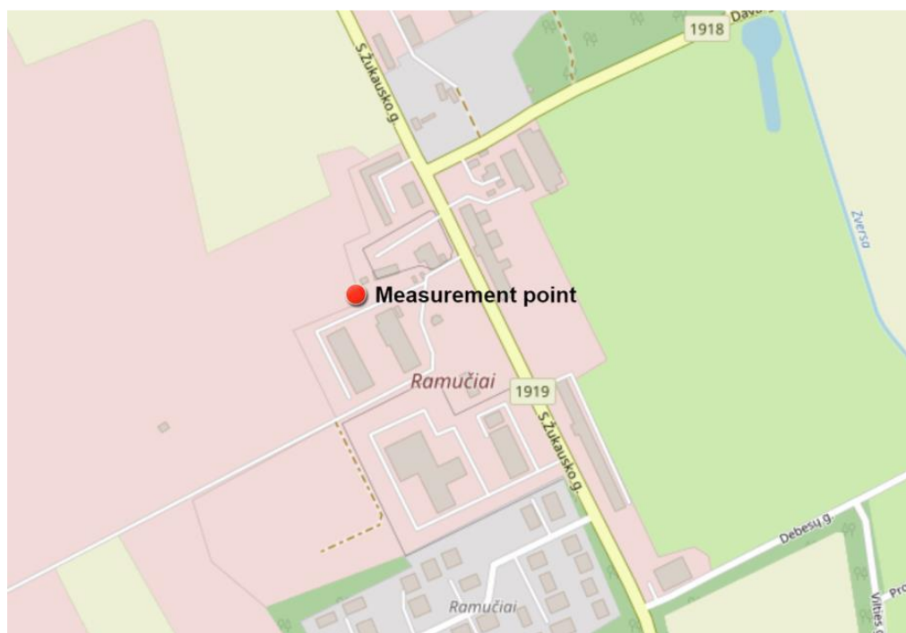
4 Pav. Matavimų vieta