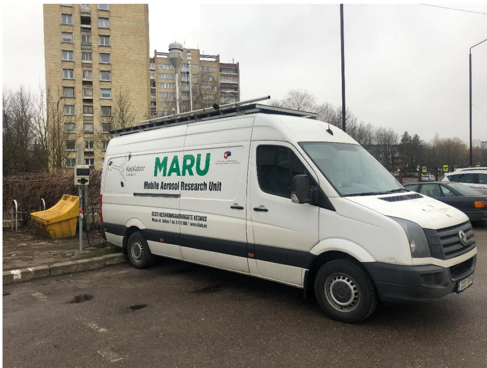
3 paveikslas. Mobilioji transporto priemonė ir tyrimo vieta