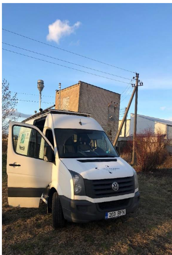
1 paveikslas. Mobilioji transporto priemonė ir tyrimo vieta

UAB Kauno kogeneracinė jėgainė užsakė 24 valandų trukmės aplinkos oro kokybės vertinimo ir stebėjimo tyrimą Ramučiuose, Kauno raj. Tyrimas atliktas 2020 02 17 – 2020 02 18 dienomis. Matavimai atlikti ir oro kokybė įvertinta vietoje, kurios koordinatės – 54°56'27.5"N; 24°02'17.4"E (žr. 1 ir 4 paveikslus). Matavimo rezultatai surinkti siekiant nustatyti oro teršalų koncentracijos dydį aplinkos ore bei įvertinti toliau pateiktų teršalų kiekį: vandenilio chlorido (HCl), vandenilio fluorida (HF), amoniako (NH 3 ), benzo(a)pireno (B(a)P) ir dioksinų (PCDD) ir furanų (PCDFs). Taip pat tyrimo metu atlikti vietos meteorologinių parametru matavimai.