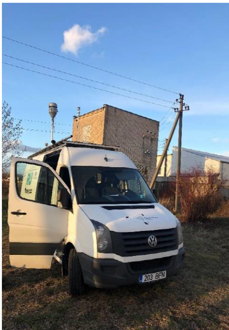
3 paveikslas. Mobilioji transporto priemonė ir tyrimo vieta