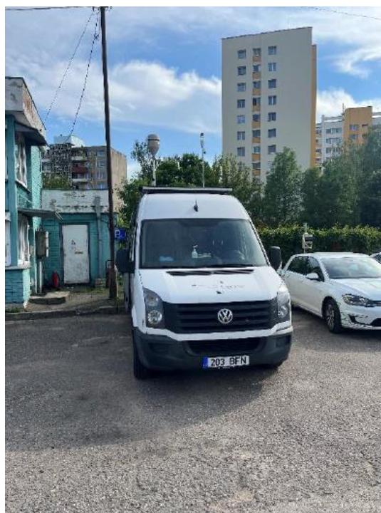
1 Pav. Mobilioji transporto priemonė ir tyrimo vieta

UAB Kauno kogeneracinė jėgainė užsakė 24 valandų trukmės aplinkos oro kokybės vertinimo ir stebėjimo tyrimą Kauno m. Partizanų g. 79. Tyrimas atliktas 2022 06 07 – 2022 06 08 dienomis. Matavimai atlikti ir oro kokybė įvertinta vietoje, kurios koordinatės – 54°55'47.3"N; 23°59'45.2"E (žr. 1 ir 4 paveikslus). Matavimo rezultatai surinkti siekiant nustatyti oro teršalų koncentracijos dydį aplinkos ore bei įvertinti toliau pateiktų teršalų kiekį: vandenilio chlorido (HCl), vandenilio fluorida (HF), amoniako (NH 3 ), benzo(a)pireno (B(a)P). Taip pat, vietoje buvo išmatuoti meteorologiniai parametrai.