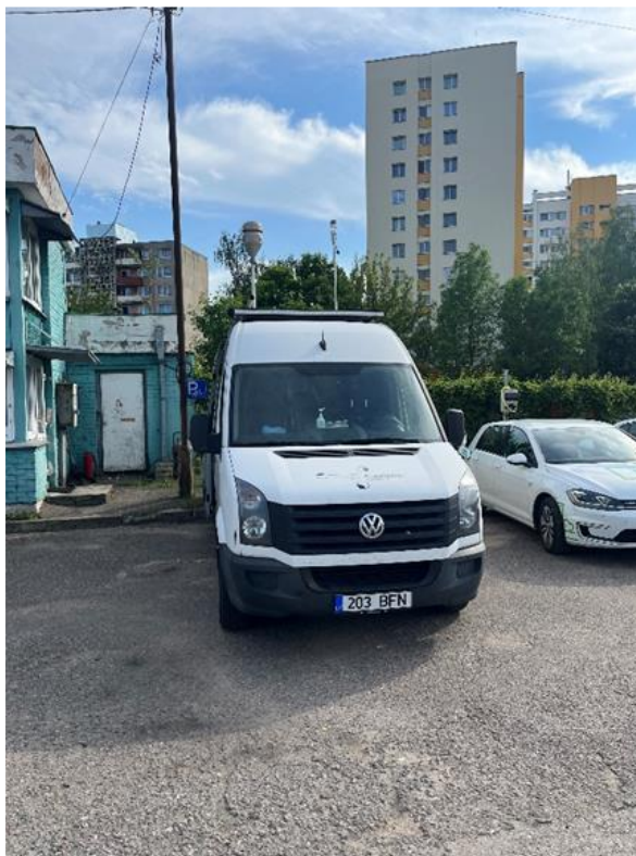
3 Pav. Mobilioji transporto priemonė ir tyrimo vieta