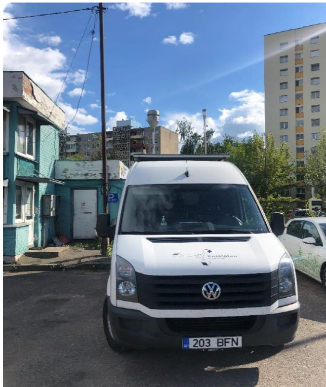
3 paveikslas. Mobilioji transporto priemonė ir tyrimo vieta