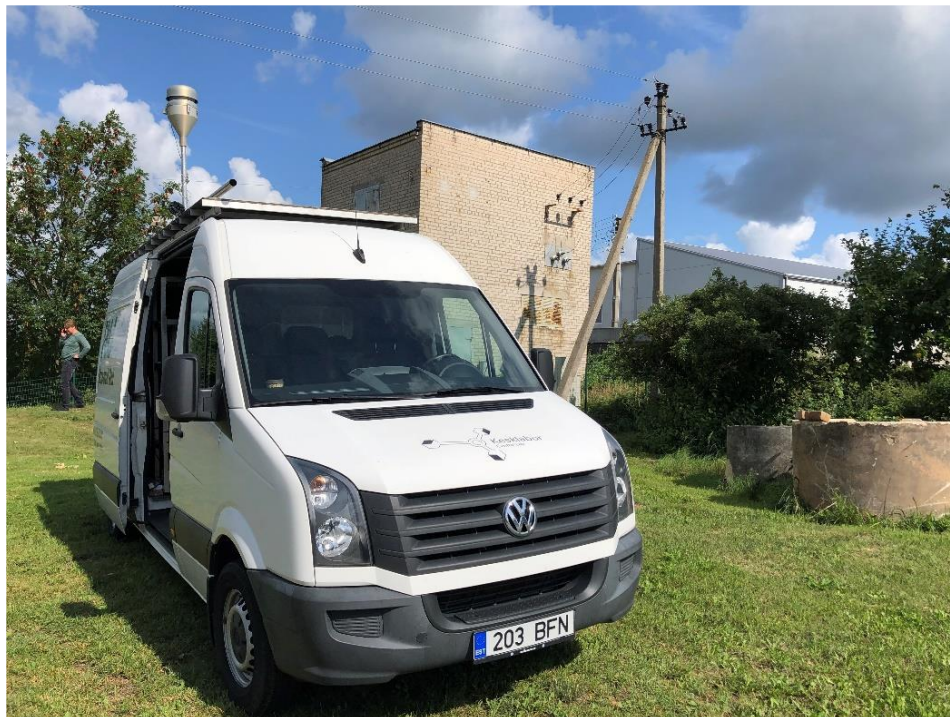
3 paveikslas. Mobilioji transporto priemonė ir tyrimo vieta