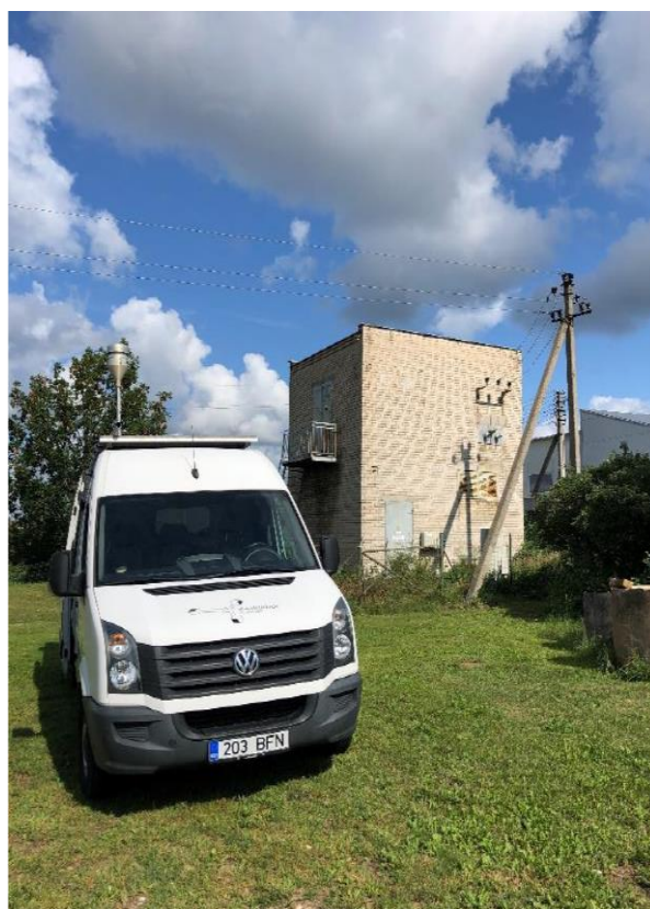
1 paveikslas. Mobilioji transporto priemonė ir tyrimo vieta

UAB Kauno kogeneracinė jėgainė užsakė 24 valandų trukmės aplinkos oro kokybės vertinimo ir stebėjimo tyrimą Ramučiuose, Kauno raj. Tyrimas atliktas 2019 08 21 – 2019 08 22 dienomis. Matavimai atlikti ir oro kokybė įvertinta vietoje, kurios koordinatės – 54°56'27.5"N; 24°02'17.4"E (žr. 1 ir 4 paveikslus). Matavimo rezultatai surinkti siekiant nustatyti oro teršalų koncentracijos dydį aplinkos ore bei įvertinti toliau pateiktų teršalų kiekį: vandenilio chlorido (HCl), vandenilio fluorida (HF), amoniako (NH 3 ), benzo(a)pireno (B(a)P) ir dioksinų (PCDD) ir furanų (PCDFs). Taip pat tyrimo metu atlikti vietos meteorologinių parametru matavimai.