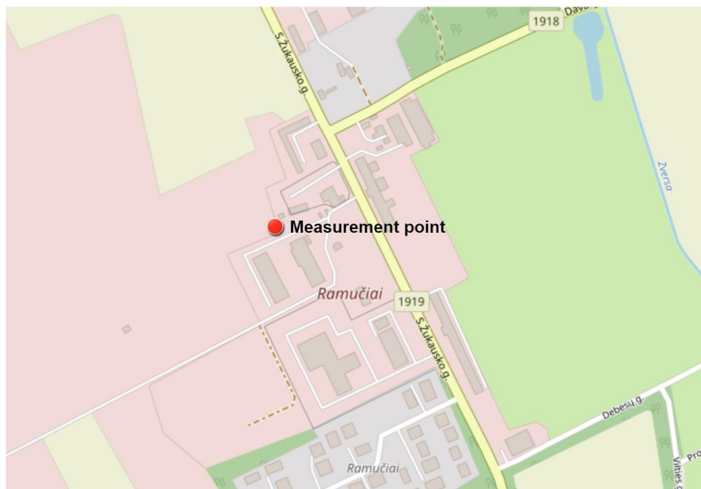
4 paveikslas. Matavimų vieta (Measurement point)