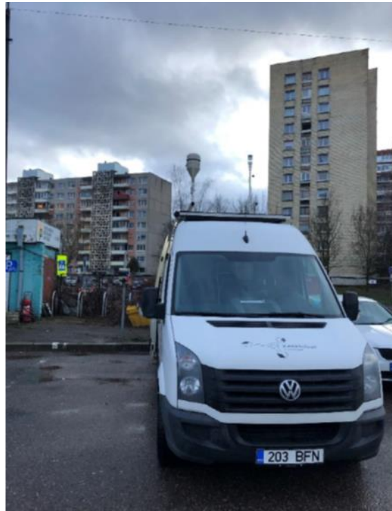
3 Pav. Mobilioji transporto priemonė ir tyrimo vieta