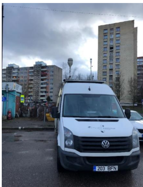
1 Pav. Mobilioji transporto priemonė ir tyrimo vieta

UAB Kauno kogeneracinė jėgainė užsakė 24 valandų trukmės aplinkos oro kokybės vertinimo ir stebėjimo tyrimą Kauno m. Partizanų g. 79. Tyrimas atliktas 2023 03 07 – 2023 03 08 dienomis. Matavimai atlikti ir oro kokybė įvertinta vietoje, kurios koordinatės – 54°55'47.3"N; 23°59'45.2"E (žr. 1 ir 4 paveikslus). Matavimo rezultatai surinkti siekiant nustatyti oro teršalų koncentracijos dydį aplinkos ore bei įvertinti toliau pateiktų teršalų kieki: vandenilio chlorido (HCl), vandenilio fluorida (HF), amoniako (NH 3 ), benzo(a)pireno (B(a)P) ir dioksinų/furanų (PCDD/Fs).