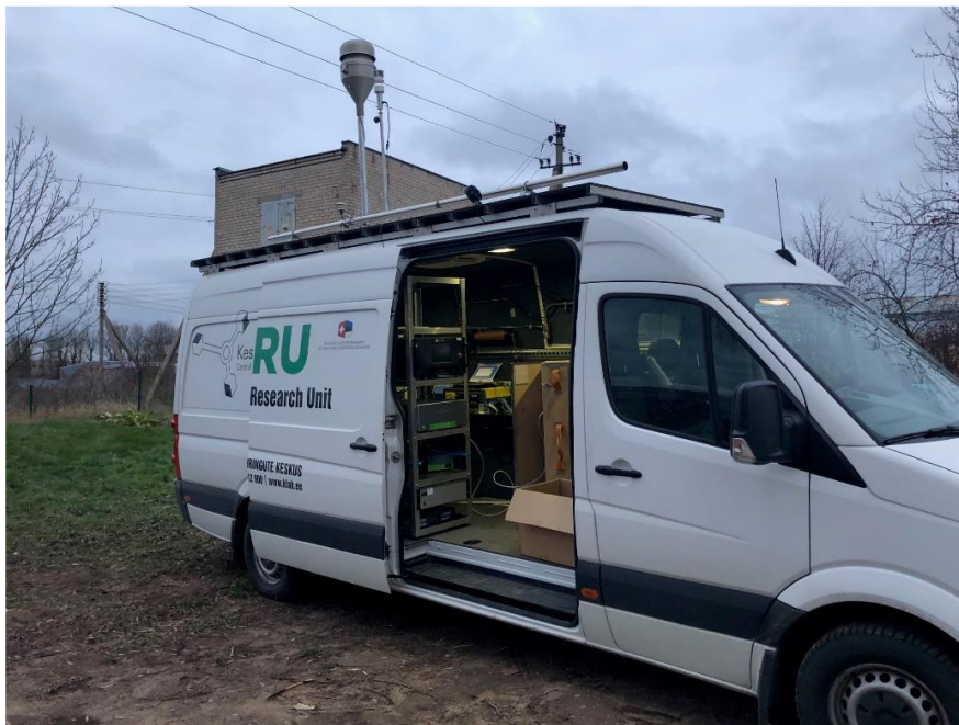
3 paveikslas. Mobilioji transporto priemonė ir tyrimo vieta