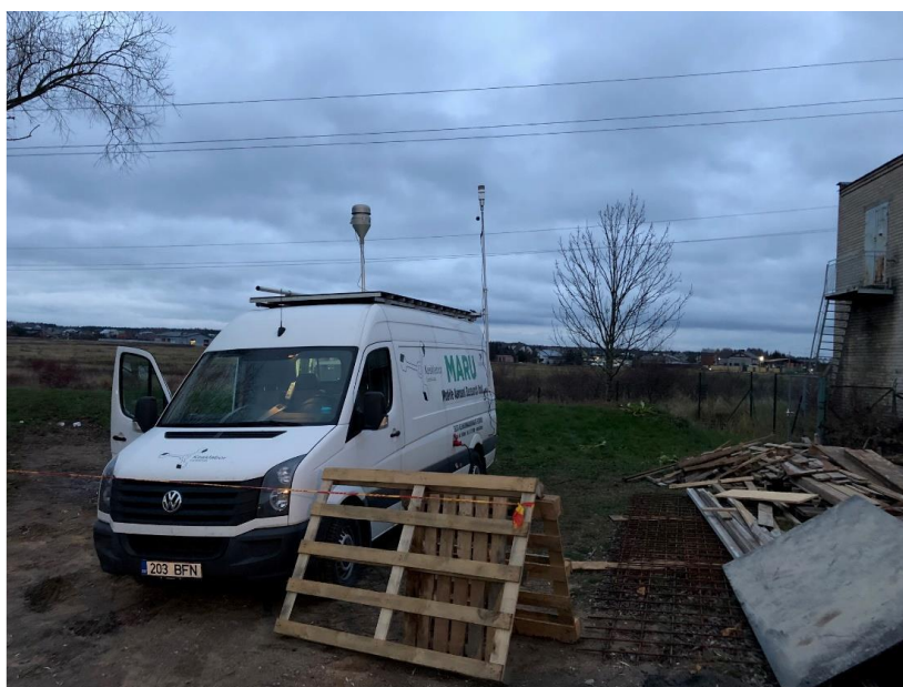
1 paveikslas. Mobilioji transporto priemonė ir tyrimo vieta

UAB Kauno kogeneracinė jėgainė užsakė 24 valandų trukmės aplinkos oro kokybės vertinimo ir stebėjimo tyrimą Ramučiuose, Kauno raj. Tyrimas atliktas 2018 11 19 – 2018 11 20 dienomis. Matavimai atlikti ir oro kokybė įvertinta vietoje, kurios koordinatės – 54°56'27.5"N; 24°02'17.4"E (žr. 1 ir 4 paveikslus). Matavimo rezultatai surinkti siekiant nustatyti oro teršalų koncentracijos dydį aplinkos ore bei įvertinti toliau pateiktų teršalų kiekį: vandenilio chlorido (HCl), vandenilio fluorida (HF), amoniako (NH 3 ), benzo(a)pireno (B(a)P). Taip pat tyrimo metu atlikti vietos meteorologinių parametru matavimai.