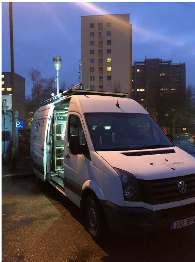
3 paveikslas. Mobilioji transporto priemonė ir tyrimo vieta