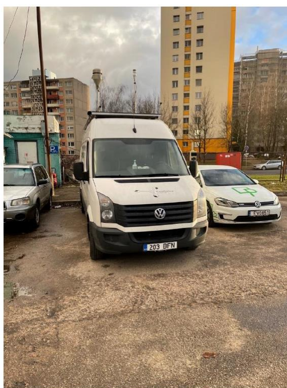
1 paveikslas. Mobilioji transporto priemonė ir tyrimo vieta

UAB Kauno kogeneracinė jėgainė užsakė 24 valandų trukmės aplinkos oro kokybės vertinimo ir stebėjimo tyrimą Kauno m. Partizanų g. 79. Tyrimas atliktas 2021 04 06 – 2021 04 07 dienomis. Matavimai atlikti ir oro kokybė įvertinta vietoje, kurios koordinatės – 54°55'47.3"N; 23°59'45.2"E (žr. 1 ir 2 paveikslus). Matavimo rezultatai surinkti siekiant nustatyti oro teršalų koncentracijos dydį aplinkos ore bei įvertinti toliau pateiktų teršalų kiekį: vandenilio chlorido (HCl), vandenilio fluorida (HF), amoniako (NH 3 ), benzo(a)pireno (B(a)P). Taip pat tyrimo metu atlikti vietos meteorologinių parametru matavimai.