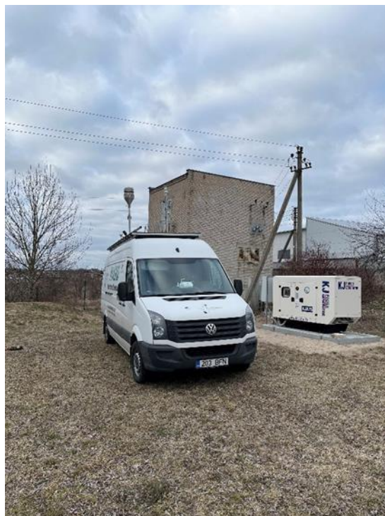
3 Pav. Mobilioji transporto priemonė ir tyrimo vieta