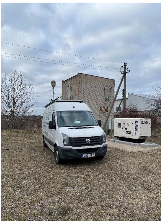
1 Pav. Mobilioji transporto priemonė ir tyrimo vieta

UAB Kauno kogeneracinė jėgainė užsakė 24 valandų trukmės aplinkos oro kokybės vertinimo ir stebėjimo tyrimą Ramučiuose, Kauno raj. Tyrimas atliktas 2022.03.07 – 2022.03.08 dienomis. Matavimai atlikti ir oro kokybė įvertinta vietoje, kurios koordinatės – 54°56'27.5"N; 24°02'17.4"E (žr. 1 ir 4 paveikslus). Matavimo rezultatai surinkti siekiant nustatyti oro teršalų koncentracijos dydį aplinkos ore bei įvertinti toliau pateiktų teršalų kieki: vandenilio chlorido (HCl), vandenilio fluorida (HF), amoniako (NH 3 ), benzo(a)pireno (B(a)P) ir dioksinų/furanų (PCDD/Fs).