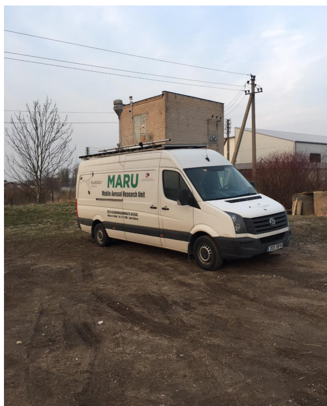
1 paveikslas. Mobilioji transporto priemonė ir tyrimo vieta

UAB Kauno kogeneracinė jėgainė užsakė 24 valandų trukmės aplinkos oro kokybės vertinimo ir stebėjimo tyrimą Ramučiuose, Kauno raj. Tyrimas atliktas 2019 02 19 – 2019 02 20 dienomis. Matavimai atlikti ir oro kokybė įvertinta vietoje, kurios koordinatės – 54°56'27.5"N; 24°02'17.4"E (žr. 1 ir 4 paveikslus). Matavimo rezultatai surinkti siekiant nustatyti oro teršalų koncentracijos dydį aplinkos ore bei įvertinti toliau pateiktų teršalų kiekį: vandenilio chlorido (HCl), vandenilio fluorida (HF), amoniako (NH 3 ), benzo(a)pireno (B(a)P) ir dioksinų (PCDD) ir furanų (PCDFs). Taip pat tyrimo metu atlikti vietos meteorologinių parametru matavimai.