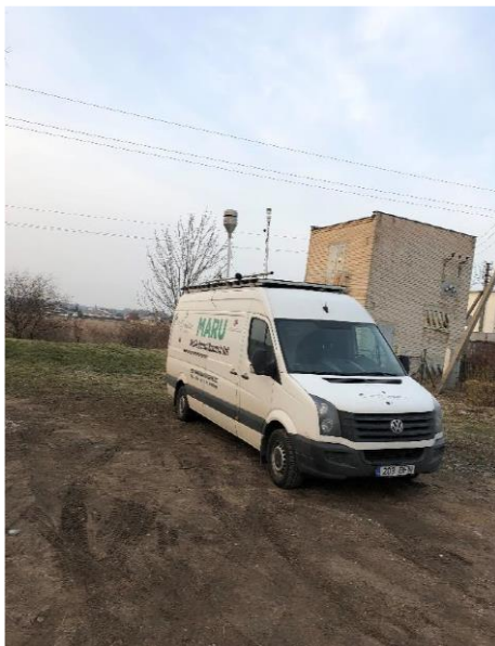
3 paveikslas. Mobilioji transporto priemonė ir tyrimo vieta