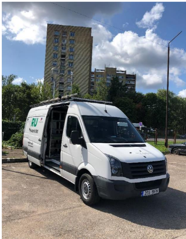
3 paveikslas. Mobilioji transporto priemonė ir tyrimo vieta