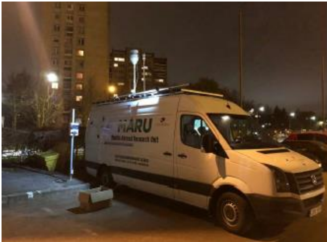
3 paveikslas. Mobilioji transporto priemonė ir tyrimo vieta