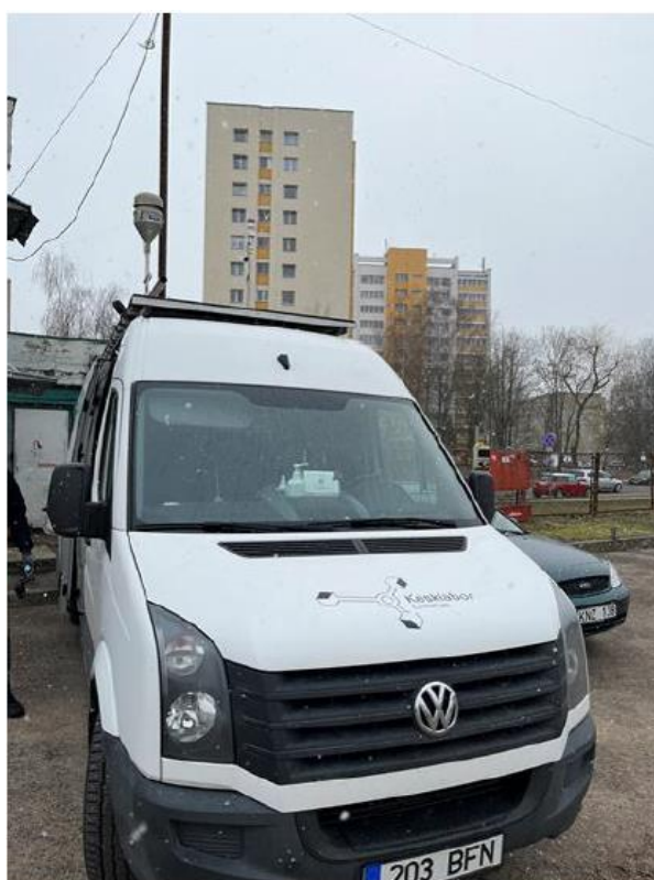
1 Pav. Mobilioji transporto priemonė ir tyrimo vieta

UAB Kauno kogeneracinė jėgainė užsakė 24 valandų trukmės aplinkos oro kokybės vertinimo ir stebėjimo tyrimą Kauno m. Partizanų g. 79. Tyrimas atliktas 2022 03 08 – 2022 03 09 dienomis. Matavimai atlikti ir oro kokybė įvertinta vietoje, kurios koordinatės – 54°55'47.3"N; 23°59'45.2"E (žr. 1 ir 4 paveikslus). Matavimo rezultatai surinkti siekiant nustatyti oro teršalų koncentracijos dydį aplinkos ore bei įvertinti toliau pateiktų teršalų kiekį: vandenilio chlorido (HCl), vandenilio fluorida (HF), amoniako (NH 3 ), benzo(a)pireno (B(a)P) ir dioksinų/furanų (PCDD/Fs).