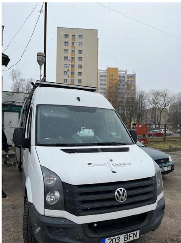
3 Pav. Mobilioji transporto priemonė ir tyrimo vieta