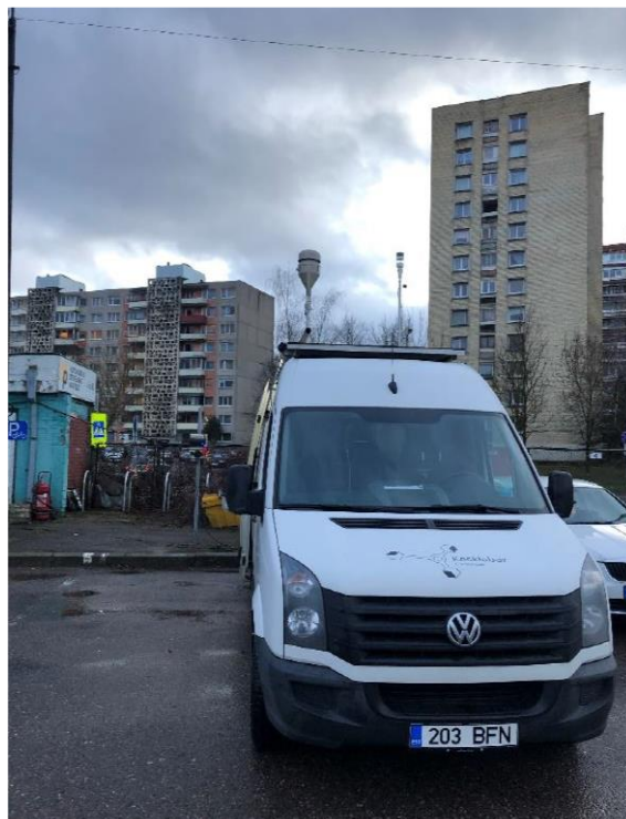
1 paveikslas. Mobilioji transporto priemonė ir tyrimo vieta

UAB Kauno kogeneracinė jėgainė užsakė 24 valandų trukmės aplinkos oro kokybės vertinimo ir stebėjimo tyrimą Kauno m. Partizanų g. 79. Tyrimas atliktas 2020 02 18 – 2020 02 19 dienomis. Matavimai atlikti ir oro kokybė įvertinta vietoje, kurios koordinatės – 54°55'47.3"N; 23°59'45.2"E (žr. 1 ir 2 paveikslus). Matavimo rezultatai surinkti siekiant nustatyti oro teršalų koncentracijos dydį aplinkos ore bei įvertinti toliau pateiktų teršalų kiekį: vandenilio chlorido (HCl), vandenilio fluorida (HF), amoniako (NH 3 ), benzo(a)pireno (B(a)P) ir dioksinų (PCDDs) ir furanų (PCDFs). Taip pat tyrimo metu atlikti vietos meteorologinių parametru matavimai.