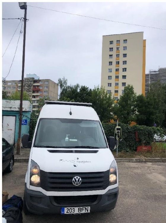
3 paveikslas. Mobilioji transporto priemonė ir tyrimo vieta