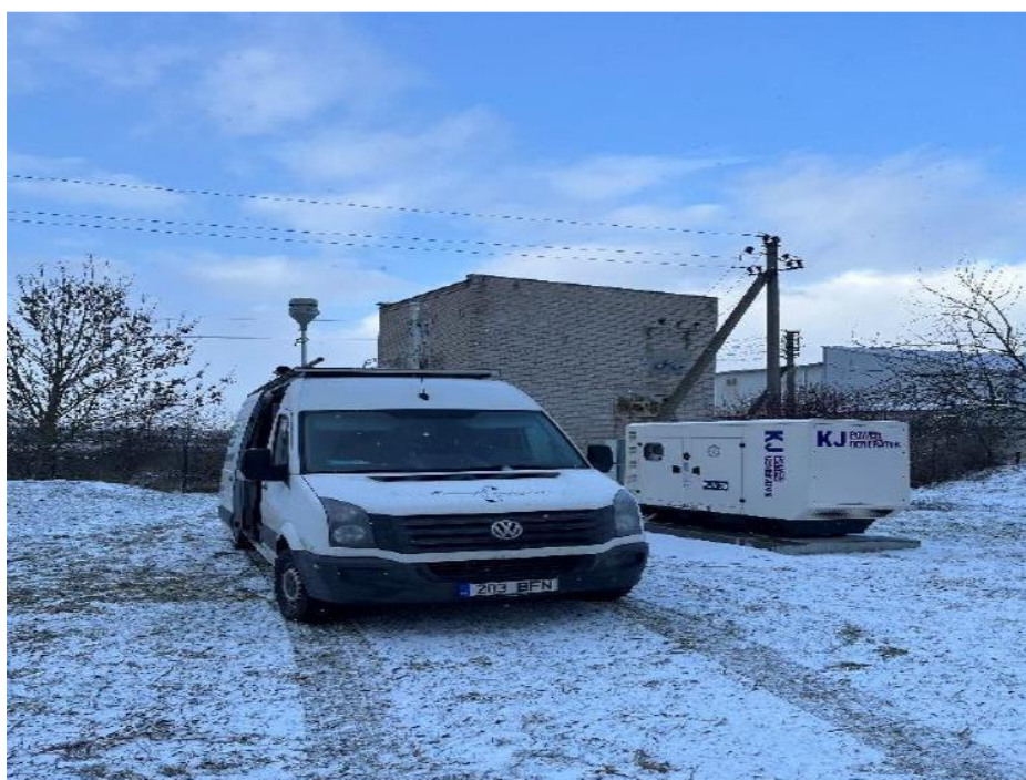
1 Pav. Mobilioji transporto priemonė ir tyrimo vieta

UAB Kauno kogeneracinė jėgainė užsakė 24 valandų trukmės aplinkos oro kokybės vertinimo ir stebėjimo tyrimą Ramučiuose, Kauno raj. Tyrimas atliktas 2023 03 06 – 2023 03 07 dienomis. Matavimai atlikti ir oro kokybė įvertinta vietoje, kurios koordinatės – 54°56'27.5"N; 24°02'17.4"E (žr. 1 ir 4 paveikslus). Matavimo rezultatai surinkti siekiant nustatyti oro teršalų koncentracijos dydį aplinkos ore bei įvertinti toliau pateiktų teršalų kiekį: vandenilio chlorido (HCl), vandenilio fluorida (HF), amoniako (NH 3 ), benzo(a)pireno (B(a)P) ir dioksinų/furanų (PCDD/Fs).