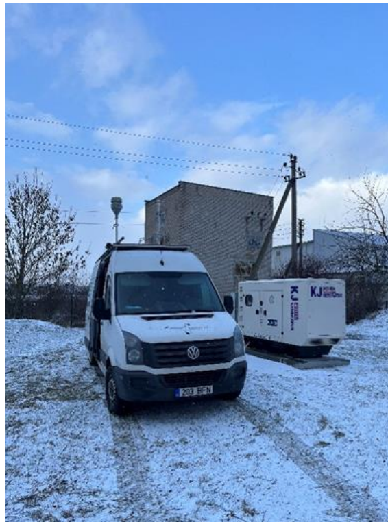
3 Pav. Mobilioji transporto priemonė ir tyrimo vieta